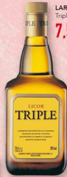
LARIOS Triple sec 7,52 €