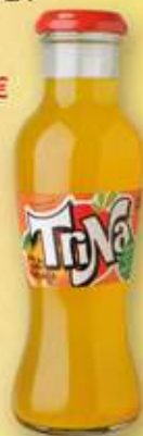
TRIN taronja 20 cl s/ret. 0,55 €