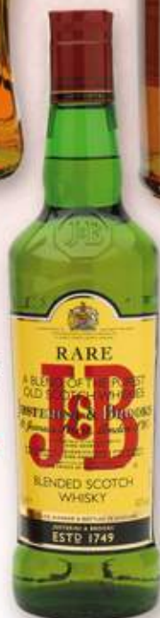
J&B Whisky 8,65 €