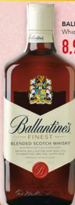
BALLANTINE'S Whisky 8,99 €