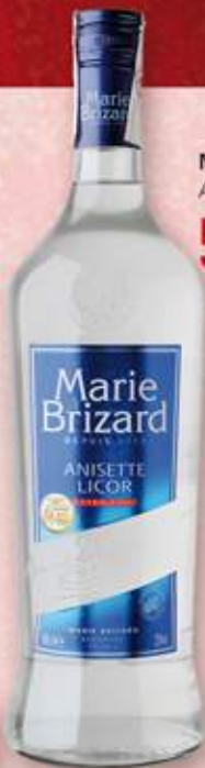
MARIE BRIZARD Anisette 5,99 €