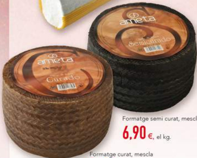
Formatge semi curat, mescla 6,90 € , el kg.