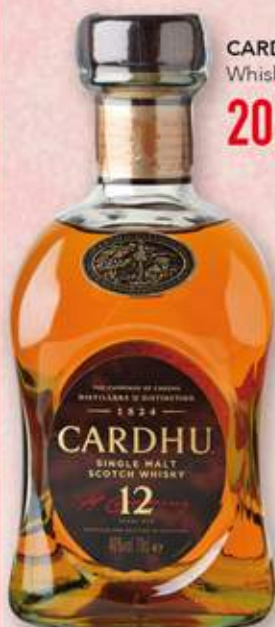
CARDHU Whisky 12 anys 20,10 €