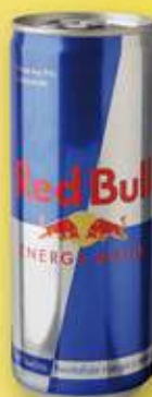
RED BULL 33 cl 0,86 €