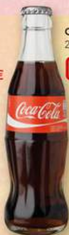
COCA-COLA 20 cl ret. 0,49 €