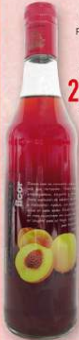
Licor préssec o Licor poma 2,27 € unitat