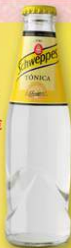
SCHWEPES tònica 25 cl s/ret. 0,56 €