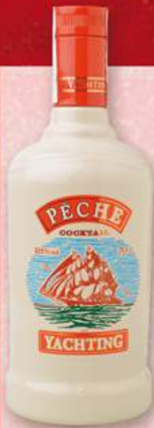
PÊCHE YACHTING Licor 5,99 €