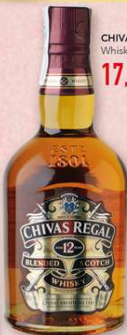
CHIVAS REGAL Whisky 12 anys 17,80 €