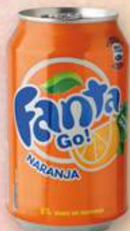
FANTA taronja o llimona 33 cl 0,40 €