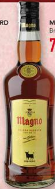
MAGNO Brandy 7,99 €