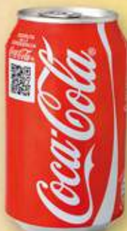
COCA-COLA 33 cl 0,40 €