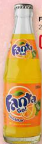
FANTA 20 cl ret. 0,49 €