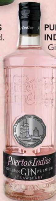
PUERTO DE INDIAS Ginebra STRAWBERRY 70 cl. 12,00 €