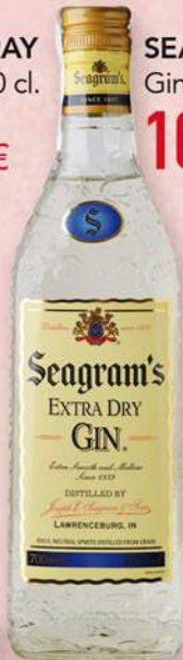
SEAGRAM'S Ginebra, 70 cl. 10,60 €