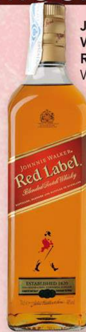
JOHNNIE WALKER Red Label Whisky 70 cl. 8,90 €