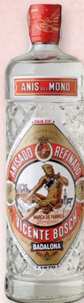
ANIS DEL MONO dolç, 70 cl. 5,80 €