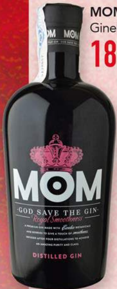
MOM Ginebra, 70 cl. 18,35 €