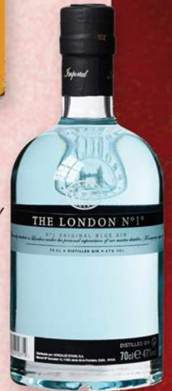
THE LONDON Nº 1 Ginebra, 70 cl. 23,80 €