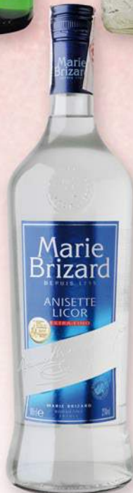
MARIE BRIZARD Anisette, 1 l. 5,99 €