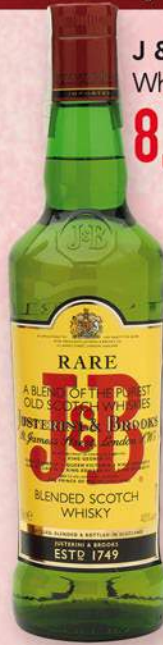
J & B Whisky, 70 cl. 8,50 €