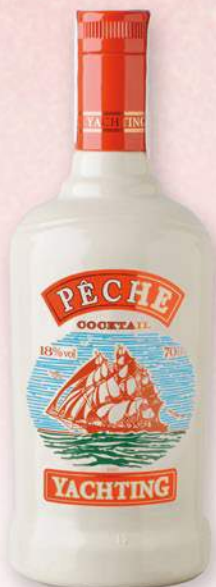
YACHTING Pêche Licor, 70 cl. 5,27 €