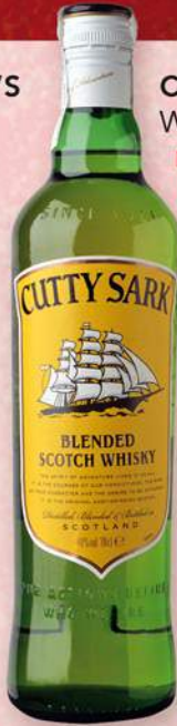
CUTTY SARK Whisky, 70 cl. 7,99 €