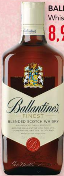
BALLANTINE'S Whisky, 70 cl. 8,99 €