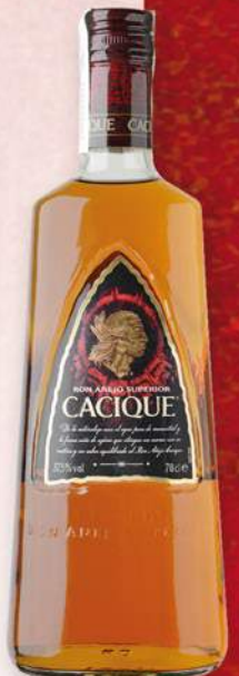
CACIQUE Rom, 70 cl. 9,40 €