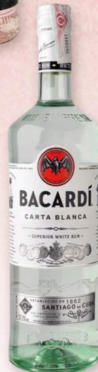
BACARDI Rom, 1 l. 11,85 €