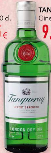
TANQUERAY Ginebra, 70 cl. 9,99 €