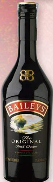
BAILEYS Licor whisky, 70 cl. 8,99 €