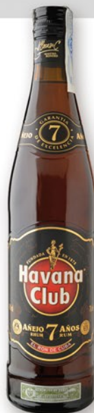
HAVANA CLUB Rom 7 anys, 70 cl. 15,90 €