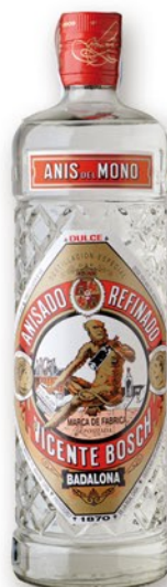
Anis del MONO Dolç, 70 cl. 5,99 €