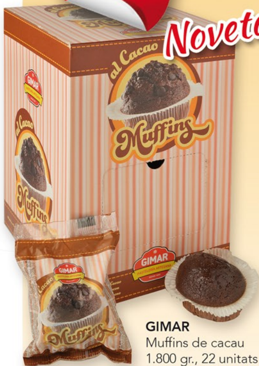
GIMAR Muffins de cacau 1.800 gr., 22 unitats