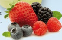
Brisa fresca 50 cl.