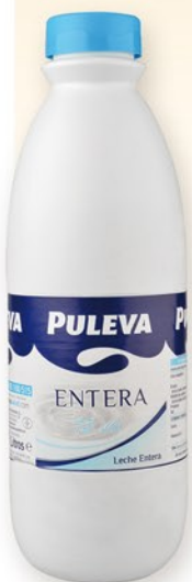
PULEVA Llet sencera 1,5 l.