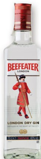
BEEFEATER Ginebra, 70 cl. 10,40 €