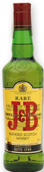
J & B Whisky, 70 cl. 8,70 €