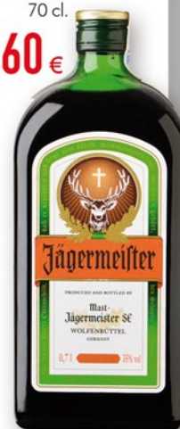
JAGERMEISTER 70 cl. 9,60 €