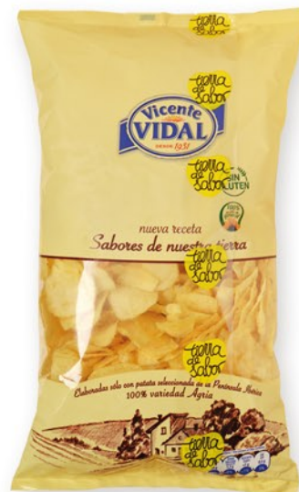
V. VIDAL Patates xips, caldera bossa 500 gr.