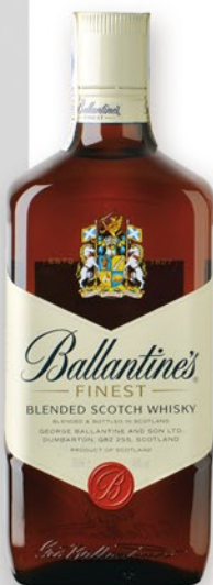
BALLANTINES Whisky, 70 cl. 9,10 €