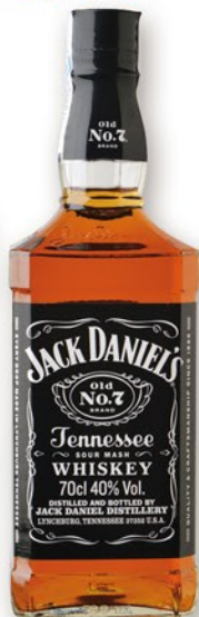
JACK DANIEL'S Whisky, 70 cl. 16,90 €