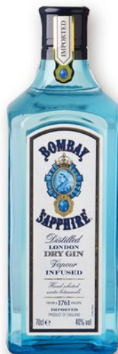
BOMBAY SAPPHIRE Ginebra, 70 cl. 15,30 €