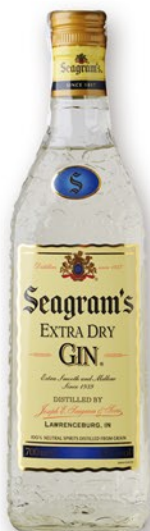
SEAGRAM'S Ginebra, 70 cl. 10,90 €