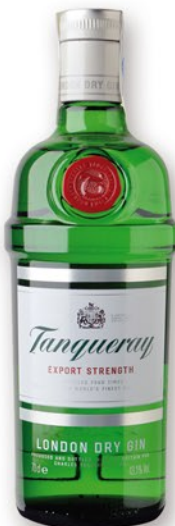
TANQUERAY Ginebra, 70 cl. 11,60 €