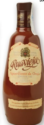
RUAVIEJA Aguardiente de "orujo", 70 cl. 8,60 €