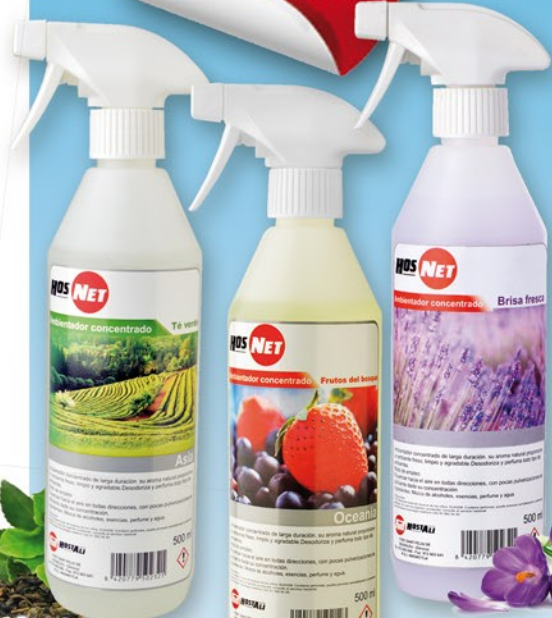
Te verd, 50 cl.