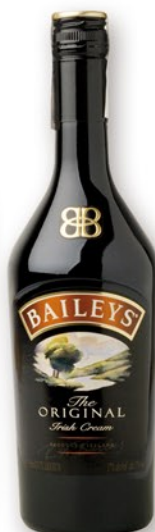
BAILEYS Irish Cream, 70 cl. 8,99 €