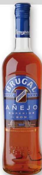
BRUGAL AÑEJO Superior Rom, 70 cl. 10,80 €