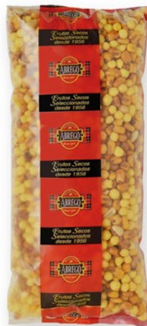
ABREGO Fruits secs, 3 var. bossa 1 kg.