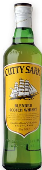
CUTTY SARK Whisky, 70 cl. 7,99 €