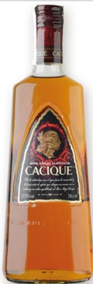
CACIQUE Rom, 70 cl. 9,80 €