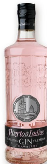
PUERTO de INDIAS Ginebra, 70 cl. 12,00 €