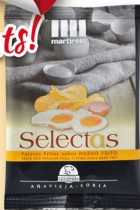
MARTIRELO Patates xips sabor ou fregit 40 gr.