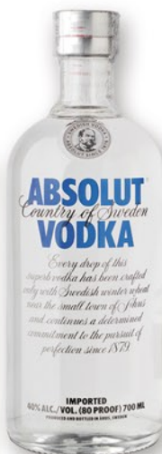
ABSOLUT Vodka, 70 cl. 9,99 €