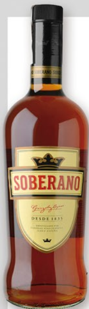
SOBERANO Brandy, 1 l. 6,99 €