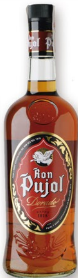
PUJOL Rom, 70 cl. 9,10 €