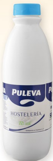
PULEVA Llet especial hostaleria 1,5 l.