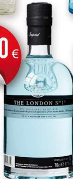
THE LONDON N° 1 Ginebra, 70 cl. 18,00 €