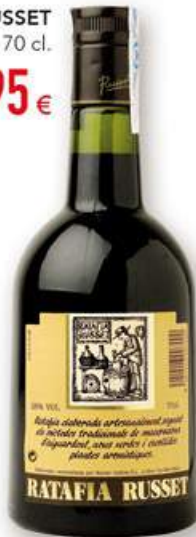
RUSSET ratafia, 70 cl. 7,95 €