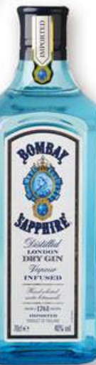
BOMBAY SAPPHIRE Ginebra, 70 cl. 15,30 €