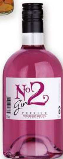
GIN N° 2 rosa Ginebra, 70 cl. 6,00 €