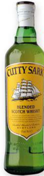
CUTTY SARK Whisky, 70 cl. 7,99 €