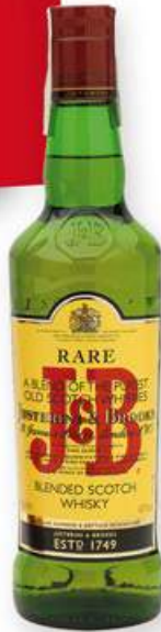
J & B Whisky, 70 cl. 8,70 €