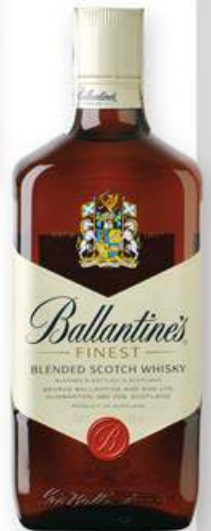
BALLANTINES Whisky, 70 cl. 9,10 €