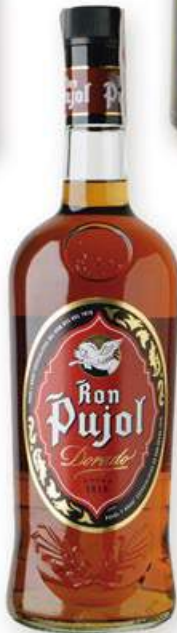
PUJOL Rom 9,10 €