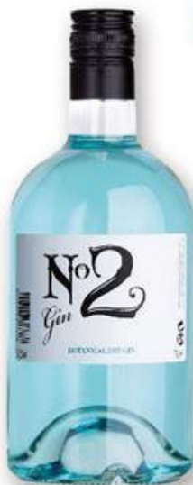
GIN N° 2 blau Ginebra, 70 cl. 6,00 €