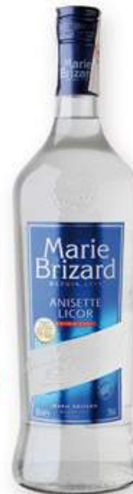
MARIE BRIZARD Anisette 70 cl. 6,50 €