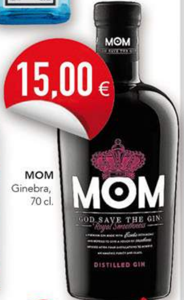
MOM Ginebra, 70 cl. 15,00 €