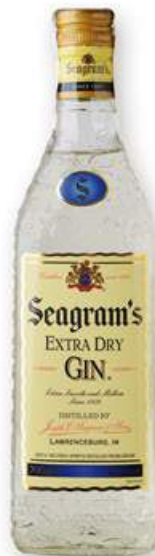
SEAGRAM'S Ginebra, 70 cl. 11,40 €