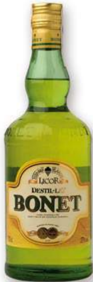
BONET Licor, 70 cl. 8,99 €