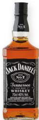
JACK DANIEL'S Whisky, 70 cl. 14,95 €