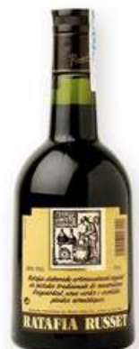
RUSSET, Ratafia, 70 cl. 7,99 €