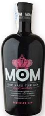
MOM Ginebra, 70 cl. 18,35 €