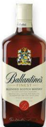
BALLANTINES Whisky, 70 cl. 9,10 €

Per la compra de 5 ampolles, 1 ampolla de REGAL!