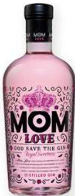
MOM LOVE Ginebra, 70 cl. 9,85 €