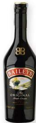
BAILEYS Crema de whisky, 70 cl. 8,15 €