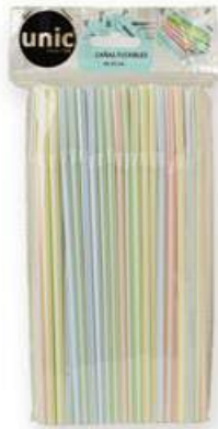
CANYETES FLEXIBLES Colors, 50 uni. 0,45 €