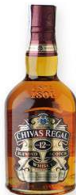
CHIVAS REGAL Whisky, 70 cl. 17,10 €