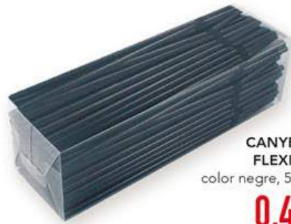
CANYETES FLEXIBLES color negre, 50 uni, 0,45 €